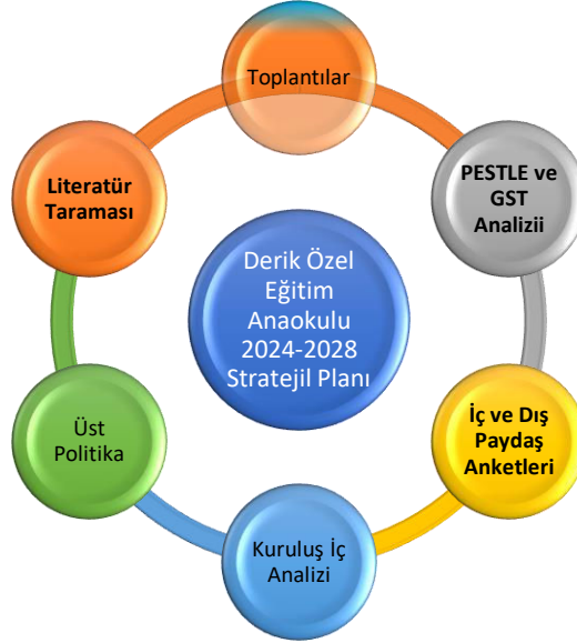
Şekil 1: Stratejik Plan Hazırlık Aşamaları

Başarılı bir stratejik planlamanın önemli adımları arasında plan hazırlık çalışmalarının belli bir sistematik yapı içerisinde yürütülmesi ve hazırlık sürecinde katılımcılığın yüksek düzeyde olması ile ekip çalışmasının sağlıklı bir şekilde gerçekleşmesi yer almaktadır. Hazırlık dönemindeki çalışmalar, Mardin İl Millî Eğitim Müdürlüğü tarafından yayımlanan Millî Eğitim Bakanlığı 2024-2028 Stratejik Plan Hazırlık Programı'nda detaylı olarak ele alınmış ve okulumuz stratejik plan hazırlığında bu program rehberliğinde ilerlenmiştir.